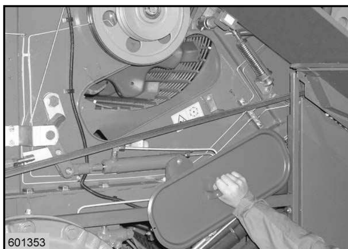
شکل ۱- فاصله بین کوبنده و ضد کوبنده

استفاده و تأثیر سه تیمار سرعت دورانی کوبنده در چهار سطح ۷۰۰، ۸۰۰، ۹۰۰ و ۱۰۰۰ دور در دقیقه، فاصله بین کوبنده و ضدکوبنده در چهار سطح ۸، ۱۰، ۱۲ و ۱۴