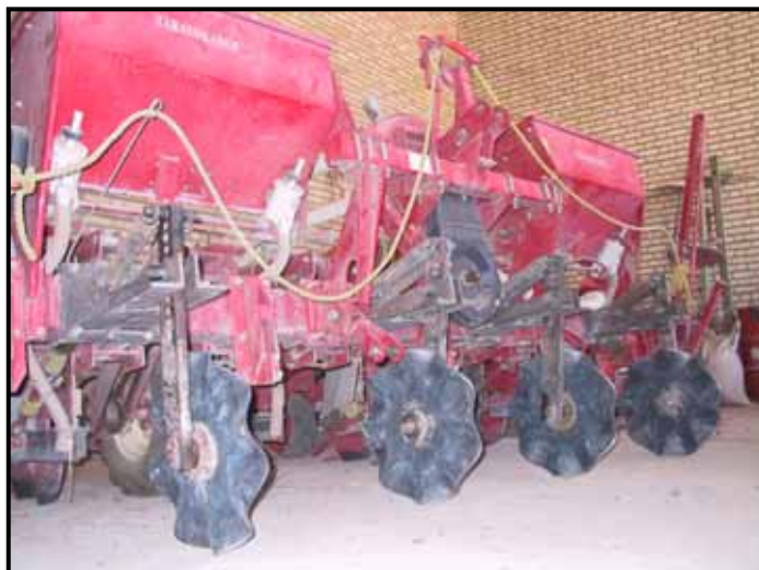
شکل ۲- ردیف‌کار مجهز به پیش‌بر مواج جهت کاشت مستقیم در بقایای ایستاده

در این ارزیابی مشخص گردید که پیش‌بر نوع لبه صاف تنها قادر به بریدن خاک و بقایاست و در هیچ یک از شرایط قادر به سست کردن نوار باریکی از خاک نیست.