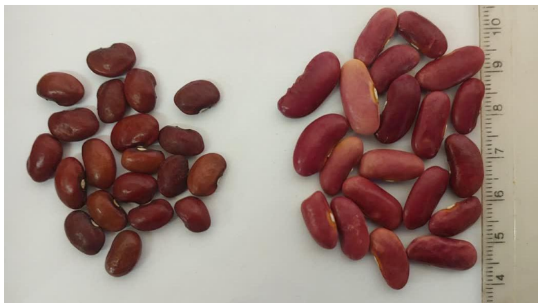
شکل ۱- نمونه‌های لوبیا بانک ژن به ترتیب از راست به چپ- لوبیا قرمز کپسولی و لوبیا قرمز متوسط